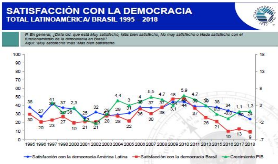
Gráfico 02 - Satisfação com a democracia nos países latino-americanos

países este resultado é próximo ter um em cada dois cidadãos satisfeitos: Uruguai com 47%, Costa Rica com 45% e Chile com 42%. Conforme observamos no gráfico 02: