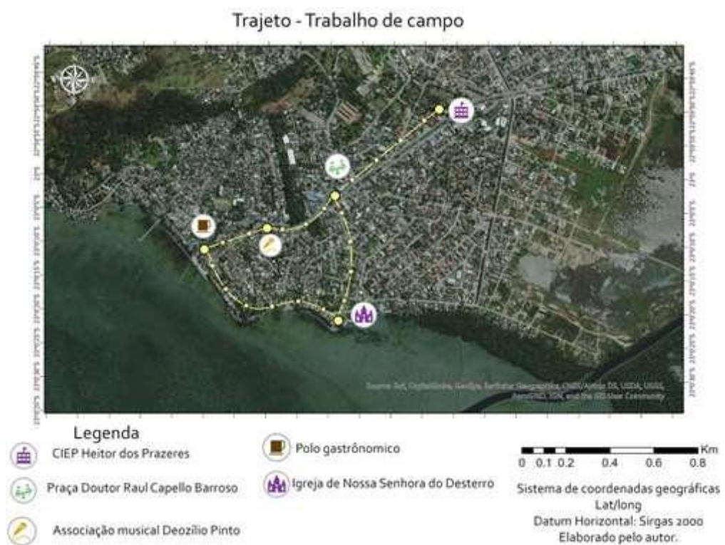
Figura 9: Roteiro proposto para o trabalho de campo.