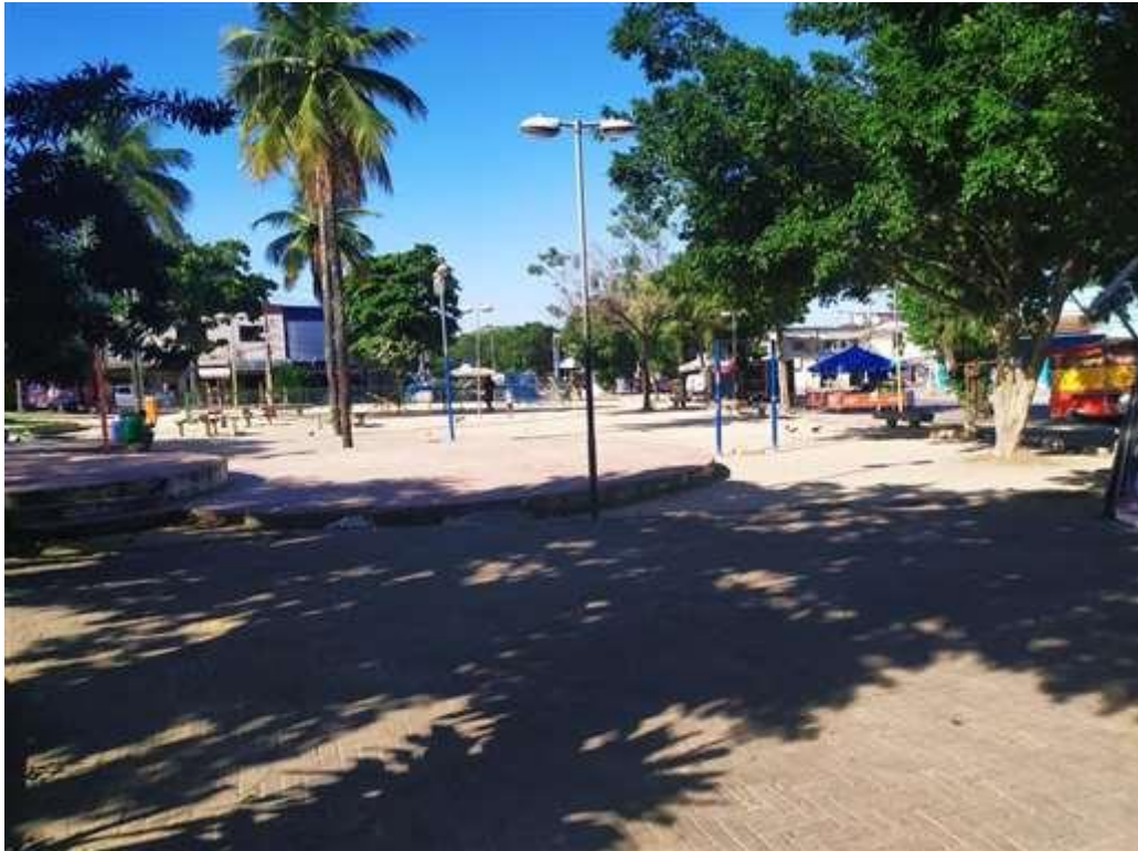
Figura 8: Popularmente chamada "Praça do rodo".

parque, montado por comerciantes autônomos para distração das crianças e também um diversificado polo gastronômico. Porém, festejo como o carnaval, faz parte das atrações executadas na praça, onde são organizados pelos comerciantes locais e a prefeitura, sendo o principal evento turístico do bairro.