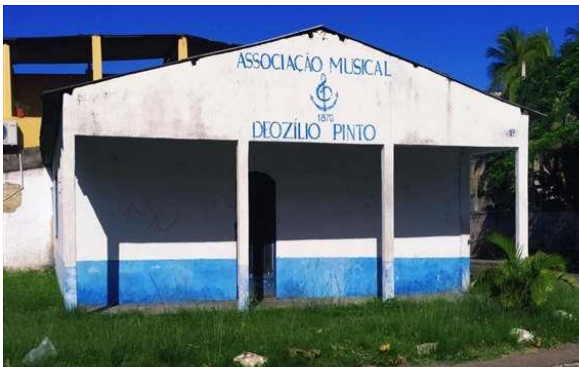
Figura 6: Fachada da Associação Musical Deozílio Pinto.

Atualmente, a Arena Cultural, cujo prédio foi inaugurado em 29 de setembro de 2012, com infraestrutura e acessibilidade, está sendo um local que proporciona mais cultura e entretenimento para o bairro, oferecendo exposições de shows, peças de teatro, para o público adulto, assim como para o infantil. Este ícone cultural também oferece cursos gratuitos (RIO DE JANEIRO, 2020).