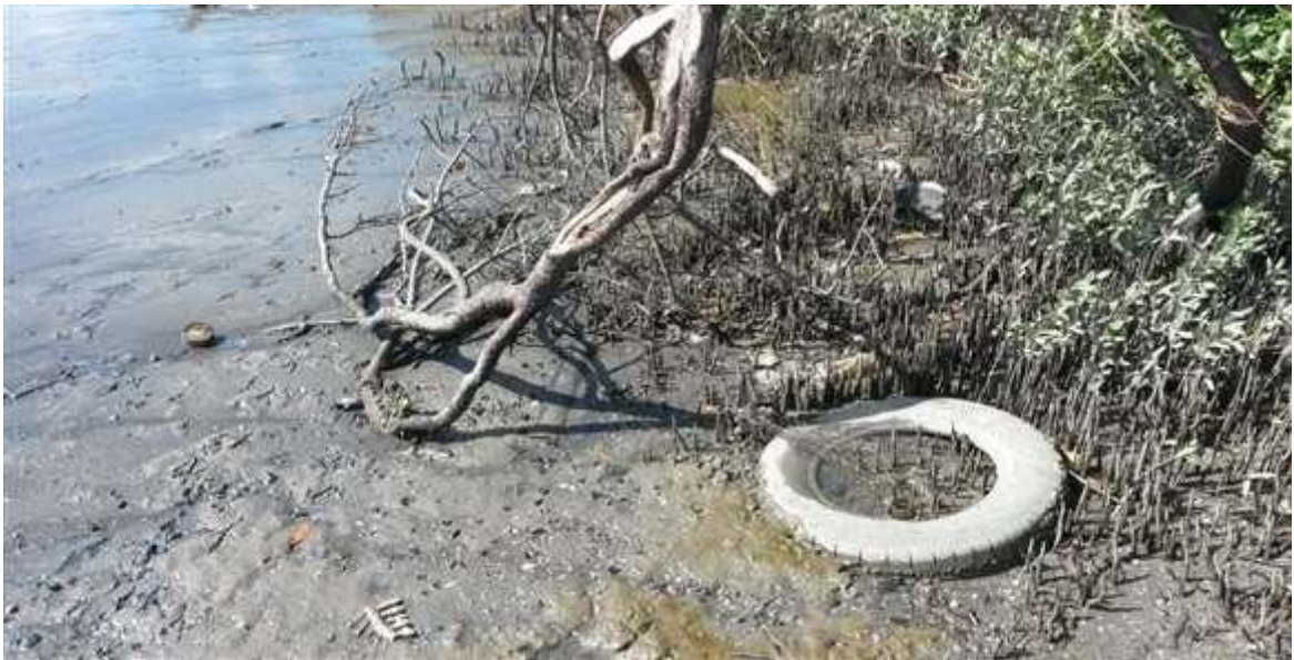
Figura 3: Poluição na baía de Sepetiba.

“Os centros de memória aparecem também como fiadores da responsabilidade histórica. Tal argumento está ligado à ideia de que as organizações não são apenas produtoras de bens e serviços, mas também de significados socioculturais” (CAMARGO; GOULART, 2015).