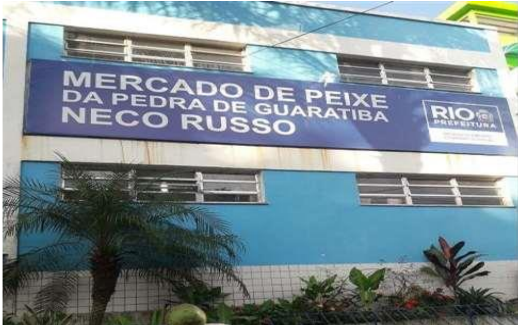
Figura 4: Fachada do Mercado de Peixe da Pedra de Guaratiba.

sociais criarem significados sociais, valendo-se de suportes materiais de sentidos e valores, que se pode compreender a gênese e a prática do patrimônio.