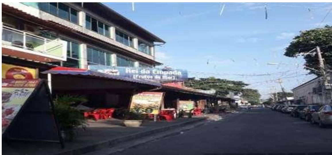
Figura 2: Acesso ao Polo Gastronômico de Pedra de Guaratiba.