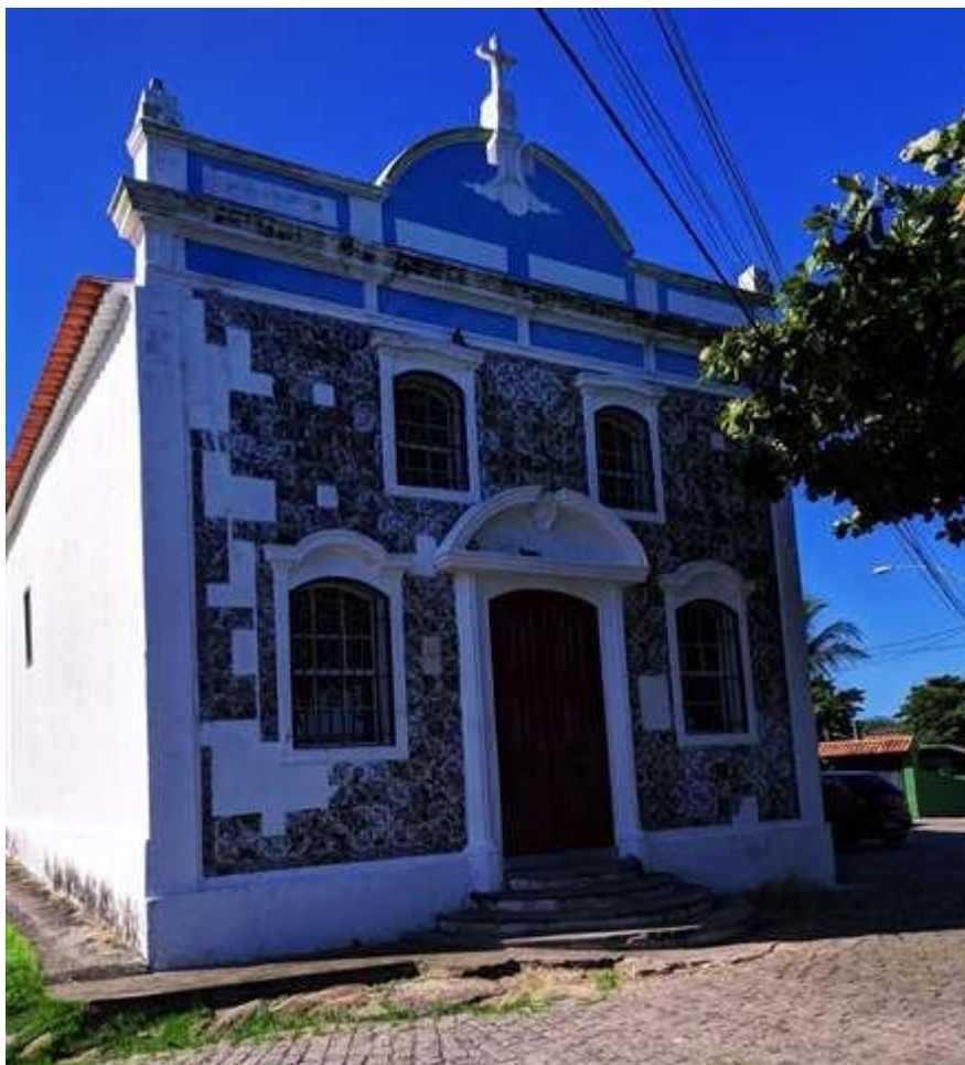
Figura 5: Fachada da Igreja Nossa Senhora do Desterro.