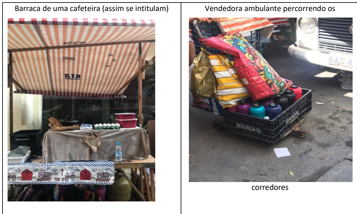
Figura 2- Imagens de distintas tipologias de venda na feira da Praça da Cruz Vermelha.